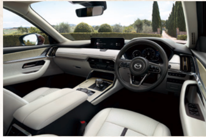
Seat: ナッパレザー (ビュアホワイト)

PHEV Premium Modern(4WD・8EC-AT/6人乗) 車両本体価格(消費税10%込) ¥7,100,500~