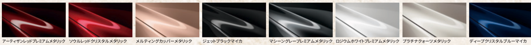
アーティザンレッドプレミアムメタリック ソウルレッドクリスタルメタリック メルティングカッパーメタリック ジェットブラックマイカ マシニンググレープレミアムメタリック ロジウムホワイトプレミアムメタリック ブラチナオートメタリック ディープクリスタルブルーマイカ