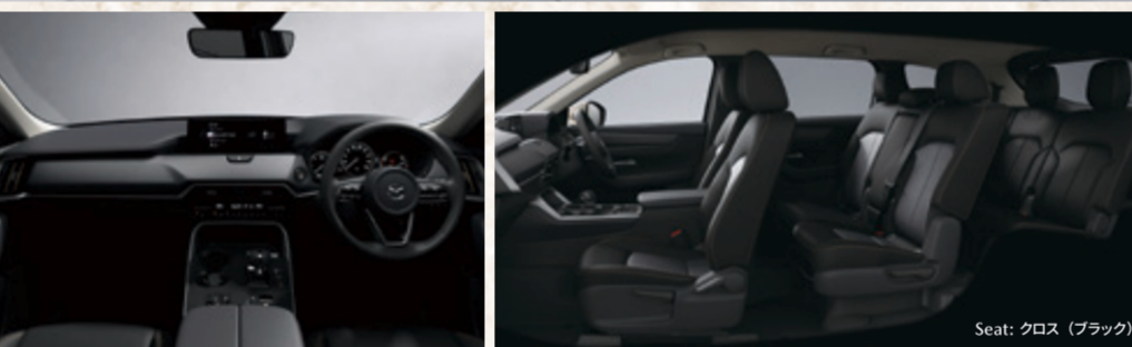
Seat: クロス (ブラック)

XD(4WD・8EC-AT/7人乗) 車両本体価格(消費税10%込) ¥4,180,000~