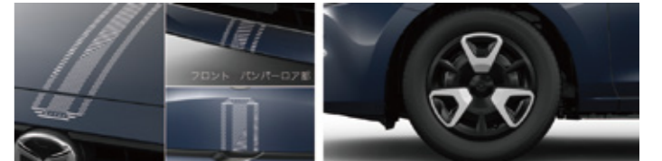
センターデカールセット (フロント/リア) ￥28,160 フルホイールキャップセット (セラミック M) ￥39,380