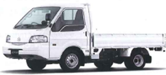
MAZDA BONGO TRUCK ▲P15

Photo: ZND-広域ハイウェイ-2.5Lターボ-2.5Lターボ-GL-1800Eハイブリッド