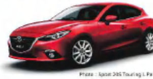
Photo: Sport 200 Touring L Package