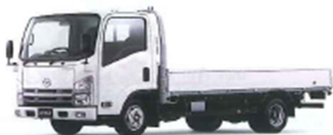
MAZDA TITAN ▲P16

Photo: 3.0ディーゼルトーボ-2トンフルワイロー-2トナキャビン-ロングボディ-ブックス仕様 (オプションありはオプションです)