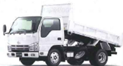
MAZDA TITAN DUMP ▲P16

Photo: 3.0ディーゼルトーボ-2トン-高床-2トナキャビン-標準ボディ-ブックス仕様