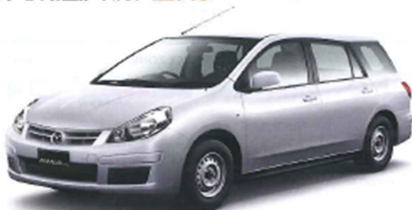
MAZDA FAMILIA VAN ▲P16