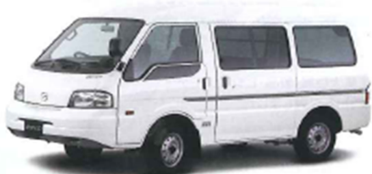
MAZDA BONGO VAN ▲P15

Photo: ZND-広域ハイウェイ-2.5Lターボ-2.5Lターボ-GL-1800Eハイブリッド