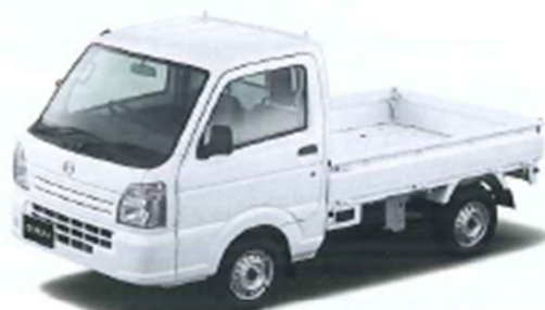
MAZDA SCRUM TRUCK ▲P14