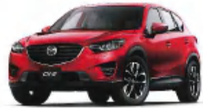
Photo: XD L Package