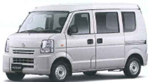
MAZDA SCRUM VAN ▲P14