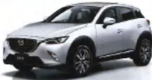
Photo: XD Touring L Package