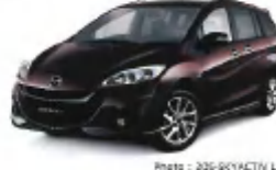
Photo: 335-SKYACTIV L Package